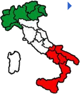
Italia, Milano - Quadro storico dei prezzi del Granoturco Nazionale e dei Semi di soia nazionale