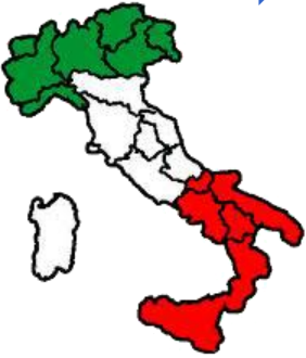
Italia - Quadro storico dei prezzi del Granoturco Nazionale, della Farina di Soia nazionale e del prezzo del Latte