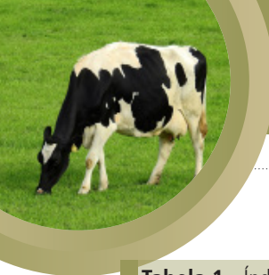
Tabela 1 - Índice de Captação do Leite do Cepea (ICAP-L)